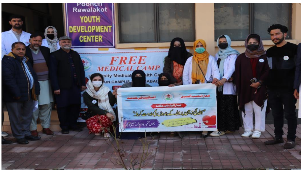
Department of Medical Lab Technology, Faculty of Health Sciences University of Poonch Rawalakot conducted a one day medical health camp at the University medical Centre for local community.